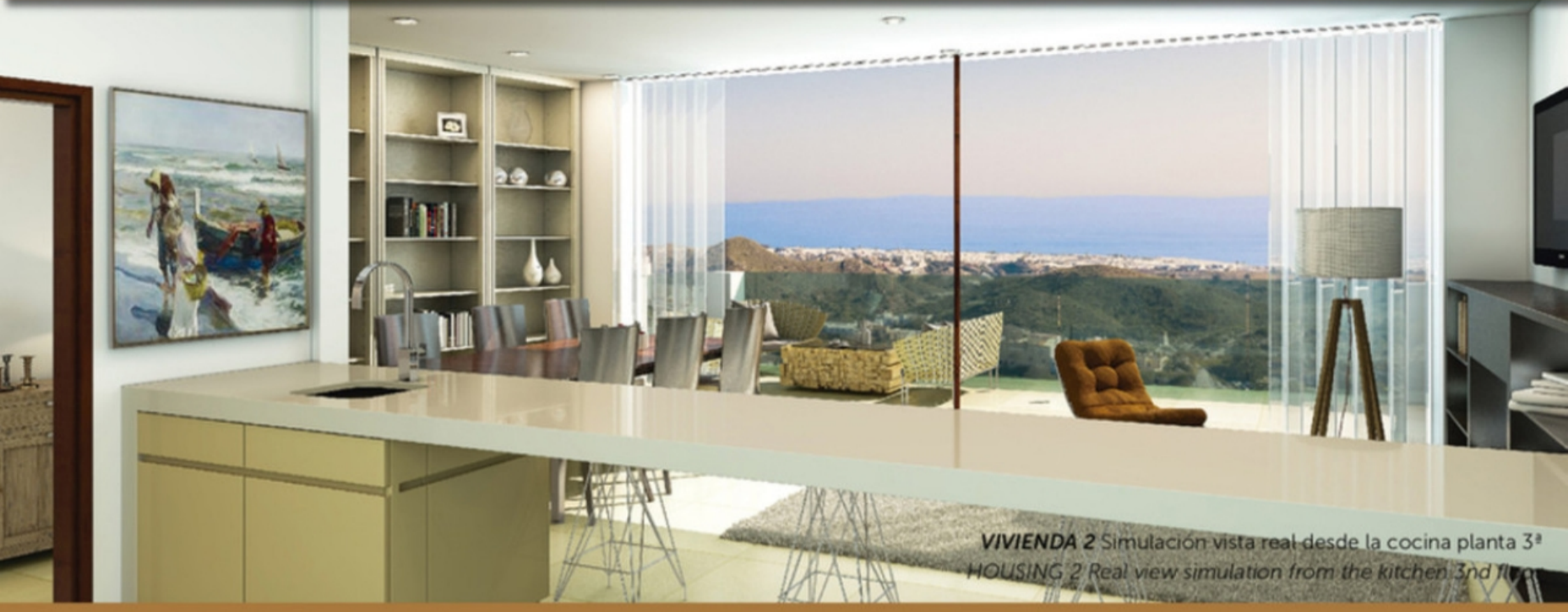
VIVIENDA 2 Simulación vista real desde la cocina planta 3ª HOUSING 2 Real view simulation from the kitchen 3rd floor

- 2 TERRAZAS / TERRACES 16 m² y 24 m² - TRASTERO / STORAGE ROOM 20 m² - PISCINA PRIVADA EN TERRAZA / PRIVATE POOL IN TERRACE